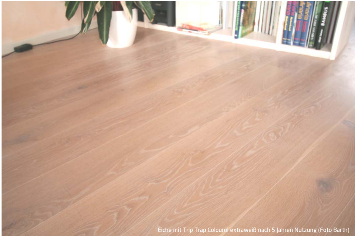
Eiche mit Trip Trap Colouröl extraweiß nach 5 Jahren Nutzung